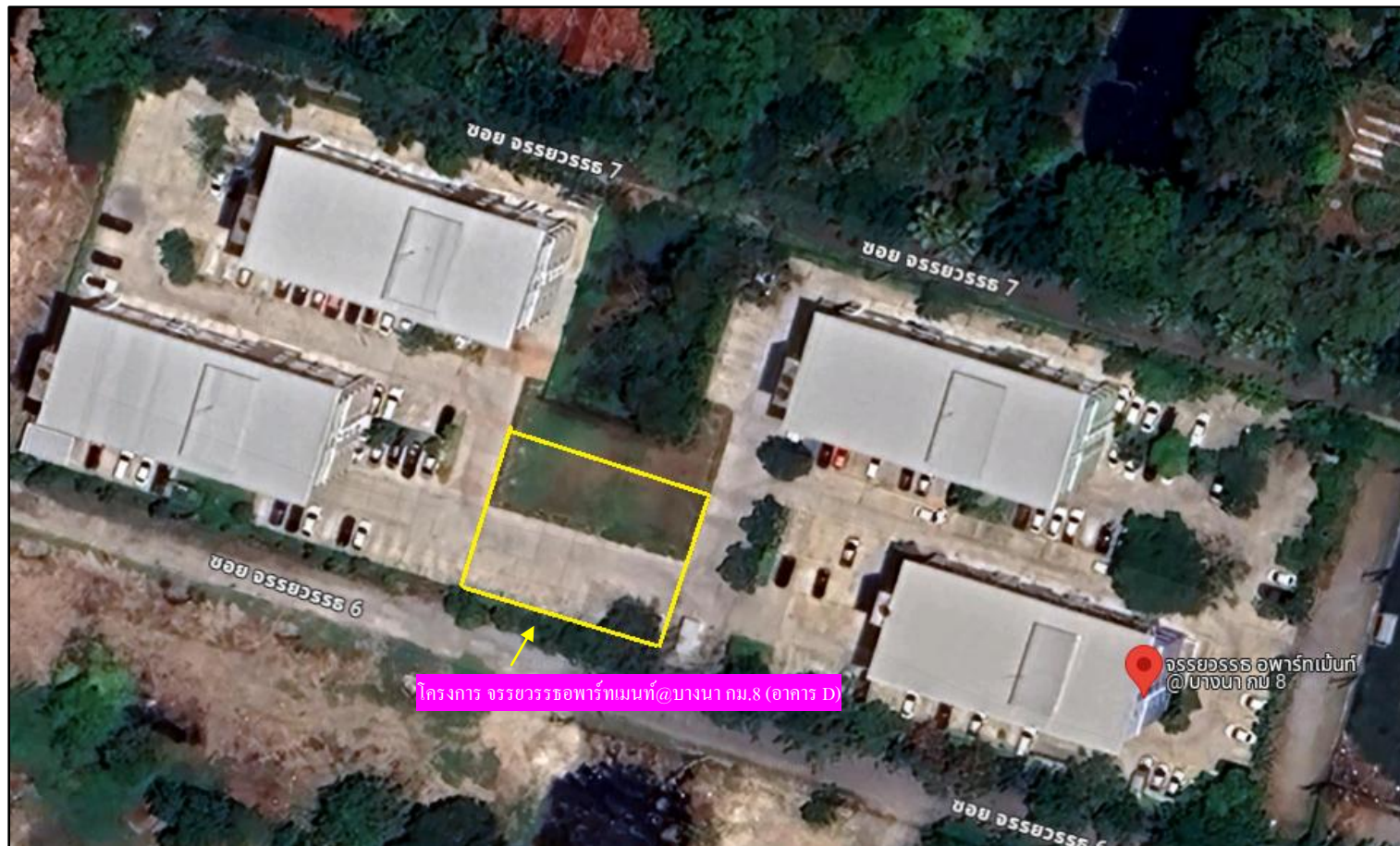
รูปที่ 1-1 แผนที่แสดงที่ตั้งโครงการ จรยวรรธอพาร์ทเมนต์@บางนา กม.8 (อาคาร D)