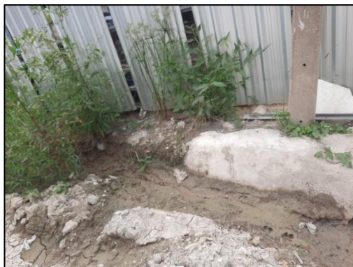
รูปที่ 1-3 รางระบายน้ำชั่วคราวล้อมรอบบริเวณพื้นที่โครงการ

การระบายน้ำทิ้งและน้ำฝนออกพื้นที่ก่อสร้าง โครงการจัดให้มีรางระบายน้ำชั่วคราวล้อมรอบบริเวณพื้นที่โครงการ ดังแสดงในรูปที่ 1-3 และจัดสร้างบ่อดักน้ำชั่วคราวหรือบ่อดักตะกอนดิน เพื่อดักเศษตะกอนดินให้จมตัวก่อนสูบบอกสู่ระบบระบายน้ำสาธารณะ ดังแสดงในรูปที่ 1-4