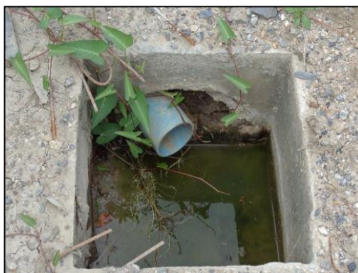
รูปที่ 1-4 บ่อดักตะกอนดิน